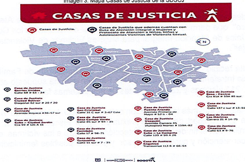
Imagen 3. Mapa Casas de Justicia de la SDSCJ