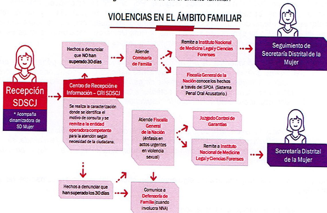
Imagen 1. Violencias en el ámbito familiar.